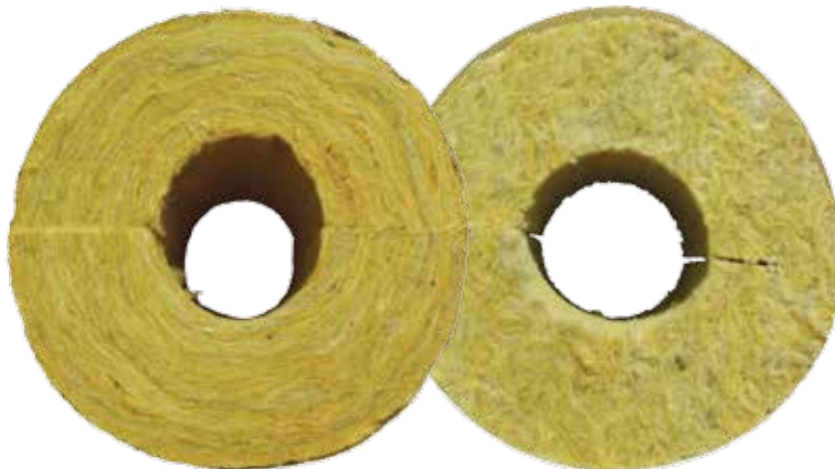
Tradicinių kevalų chaotiška plaušų struktūra

Pritaikius modernią gamybos technologiją gaminami laminarinės plaušų struktūros akmens vatos kevalai ROCKWOOL 800 , pasižymintys optimaliu tankiu, padidintu standumu ir geriausiomis šilumos izoliacijos bei eksploatacinėmis savybėmis.