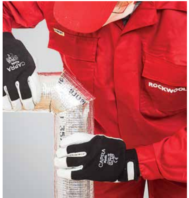
6. Visų dalių tikslus sujungimas