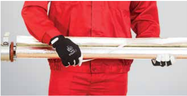
3. Apsauginės juostelės nuėmimas nuo lipnios užlaidos