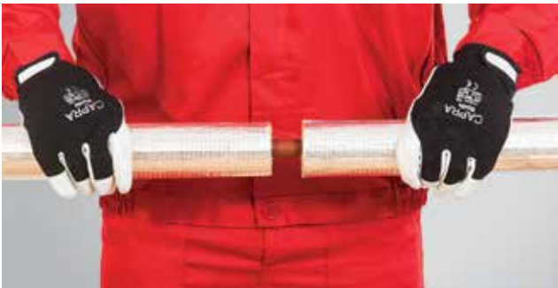
5. Dviejų gretimų kevalų sujungimas