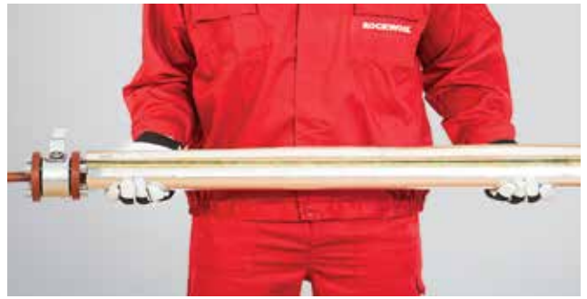
2. Izoliacija pritaikoma prie vamzdžio skersmens