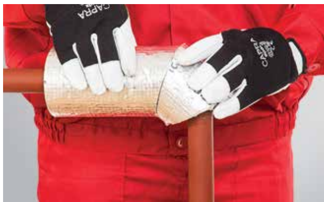
4. Tikslus alkūnės dalies sujungimas su tiesiąja kevalo dalimi