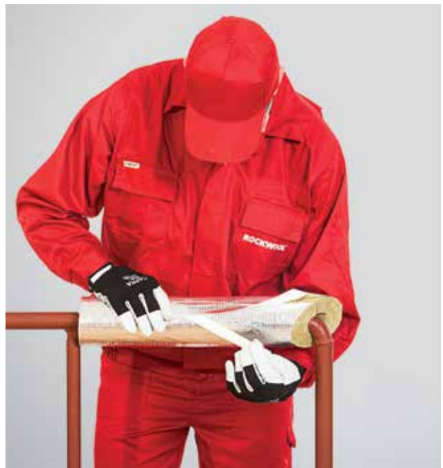
4. Išilginės kevalo įpjovos užklėjimas lipnia užlaida