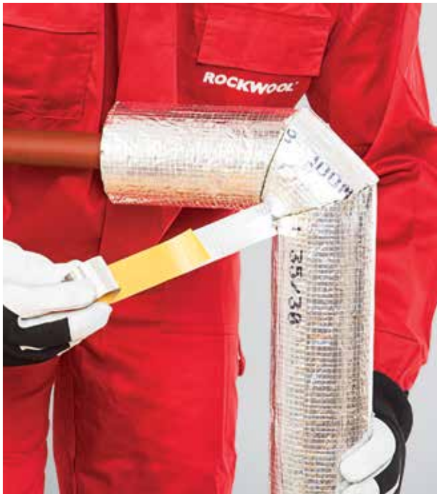
7. Skersinių sujungimų klijavimas lipnia aliuminio juosta