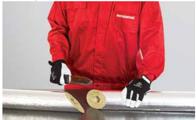
2. Į dvi dalis 45° kampu perpjautas kevalas