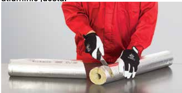
1. Alkūnės izoliacijos dalies pjovimas: 1 žingsnis

Paruoštas kevalo dalis iš eilės dedame ant vamzdžio. Pagal kevalų montavimo taisyklės pritaikome juos prie vamzdžio skersmens, sandariai uždarome. Visas išilgines įpjovas užklijuojame lipnia užlaida. Atskiras izoliacijos dalis stipriai glaudžiame vienas prie kitų, kad užtikrinti sandarumą ir izoliacijos vientisumą. Visus skersinius dalių sujungimus bei sandūras užklijuojame lipnia aliuminio juosta.