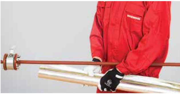
1. Kevalas dedamas ant tiesaus vamzdžio