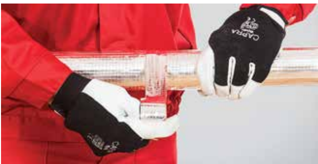
7. Kevalų sandūra užkljuojama lipnia aliuminio juosta