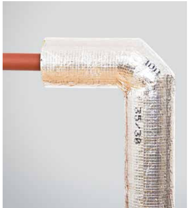
8. ROCKWOOL 800 kevalu izoliuota vamzdžio alkūnė su viena alkūnės dalimi