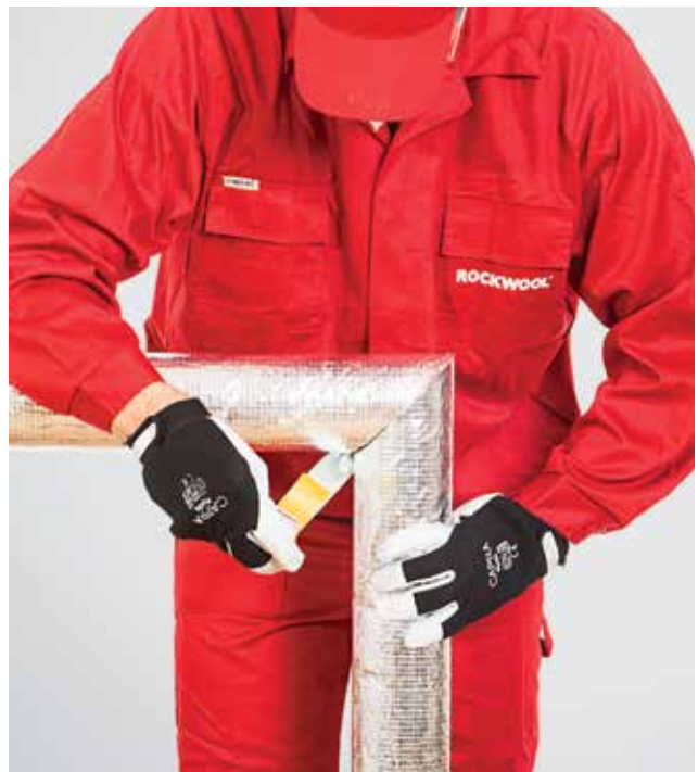
6. Skersinių kevalų sujungimo (sandūros) klijavimas lipnia aliuminio juosta