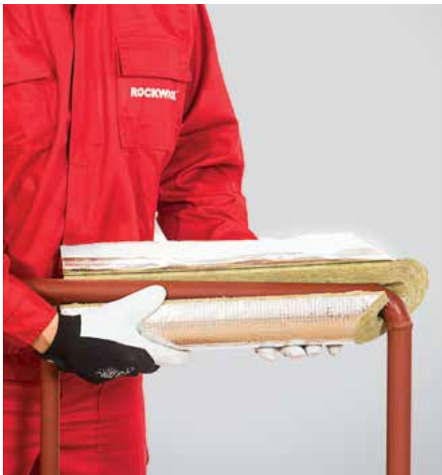
3. Pirmosios izoliacijos dalies uždėjimas ant vamzdžio