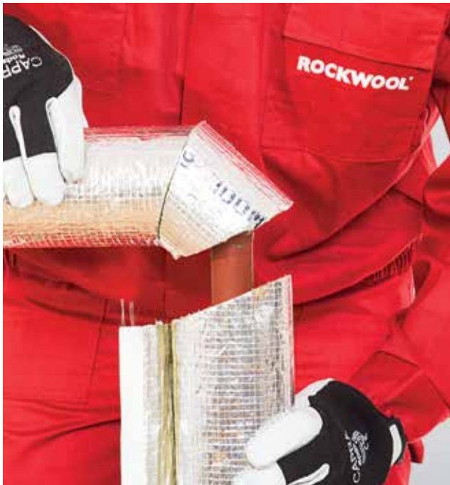
5. Tiesiosios izoliacijos dalies montavimas