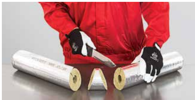
2. Alkūnės izoliacijos dalies pjovimas: 2 žingsnis