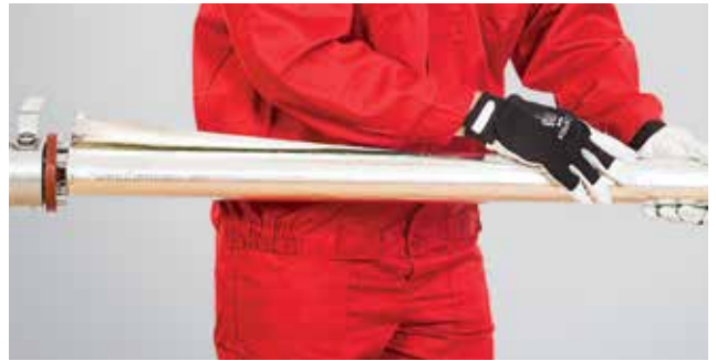
4. Tikslus lipnios užlaidos užkljavimas