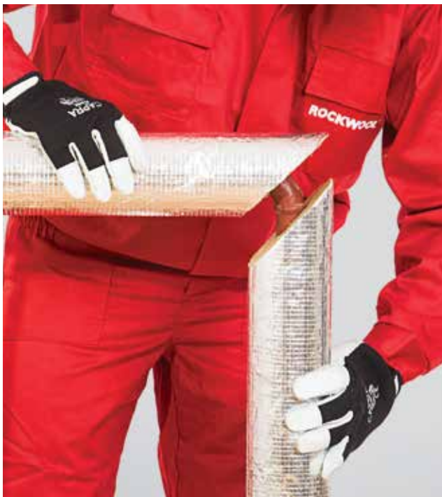
5. Alkūnės izoliacijos abiejų dalių sujungimas