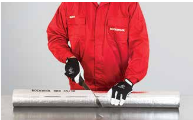
1. Kevalo pjovimas reikiamu kampu

Išilginę kevalo įpjovą uždengiame ir tiksliai užklijuojame lipnią užlaidą. Antrą iš paruoštų dalių apskukame 180° kampu ir uždėdami ant vamzdžio taip pat kaip ir pirmąją. Dalis suspaudžiame taip, kad jos susijungtų 90° kampu. Tikslus dalių sujungimas užtikrina izoliacijos sandarumą. Jungties vietą kruopščiai perklijuojame lipnia aliuminio juosta.