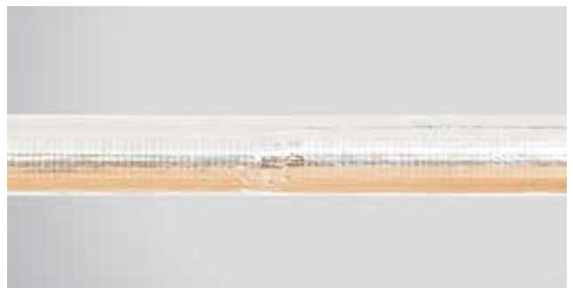
8. Paruošta izoliacija iš dviejų ROCKWOOL 800 kevalų.