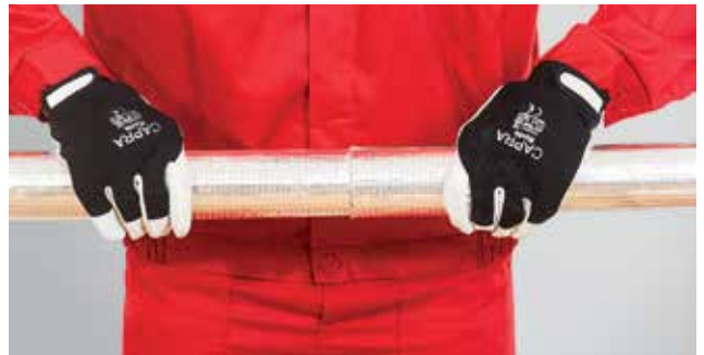
6. Dviejų gretimų kevalo galų sandarus suspaudimas