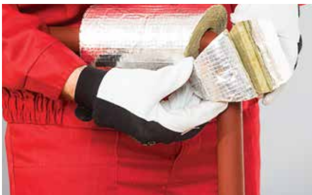
3. Alkūnės dalies montavimas